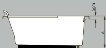
SEÇÃO A - A'

Entrada D'água: \varnothing \frac{5}{8}'' Esgoto: \varnothing 40mm