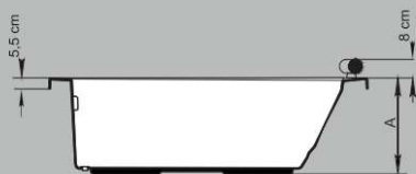
SEÇÃO A - A'